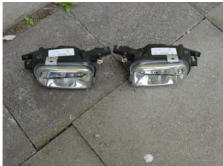
Die neuen Nebelscheinwerfer